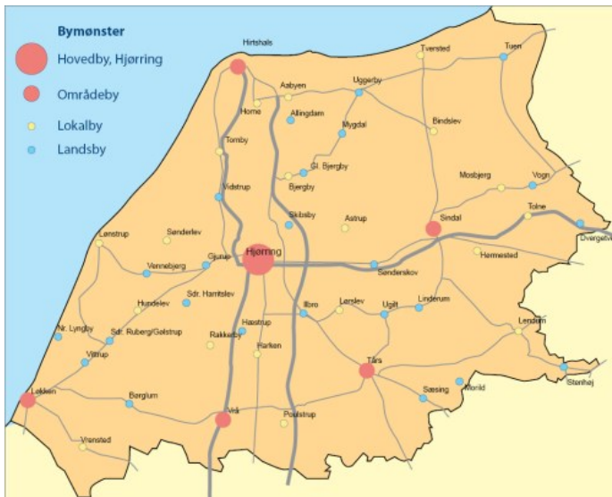
Hjørring Kommunes bymønster