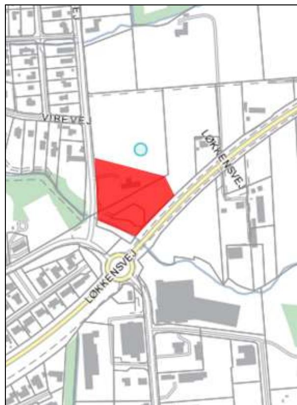
Den sydlige del udlægges til regnvandsbassin